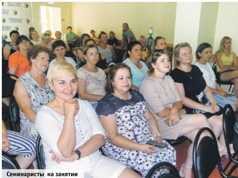
Семинаристы на занятии